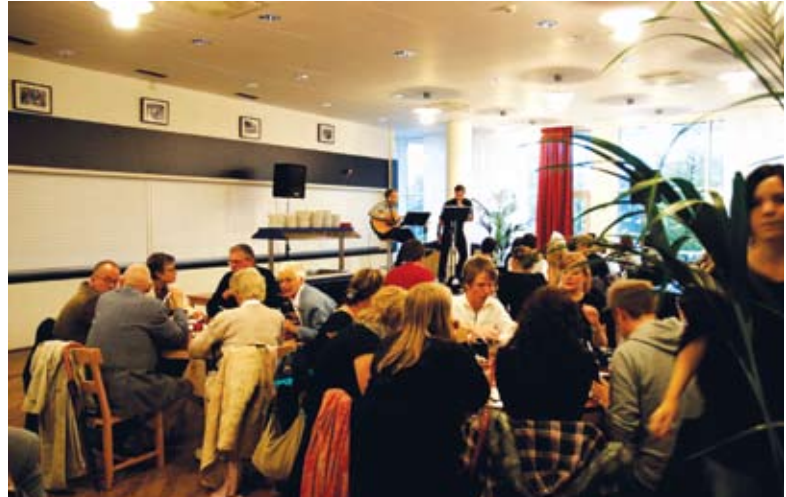
Det blev snabbt fullt vid borden i Studenternas., där trubadurer, studenter från HLK underhöll med sång och musik