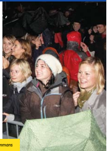
Kvällens final på den stora utomhusscenen var bejublade framträdanden av Sarah Dawn Finer och Markoolio, tillsammans med Coverlands. Stämningen var hög och publiken glad trots det dåliga vädret.