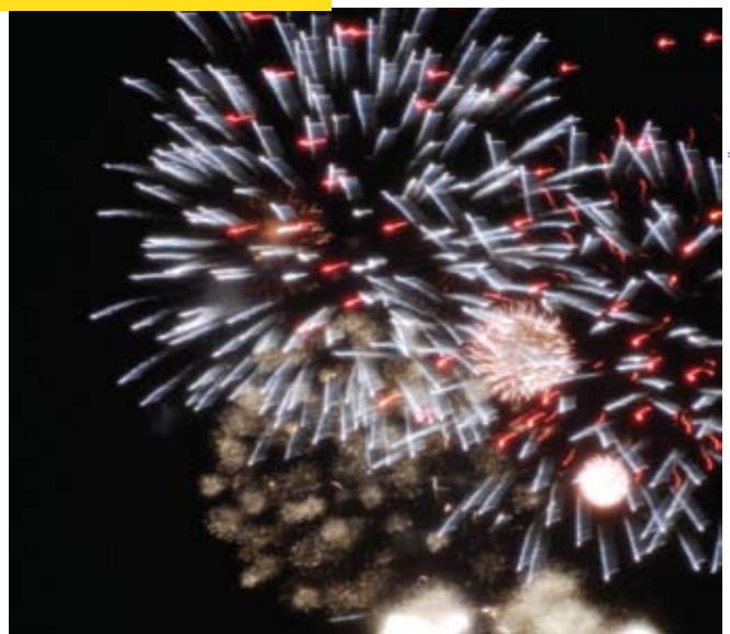
Kvällen avslutades med Student SM i fyrverkeri över Munksjön.